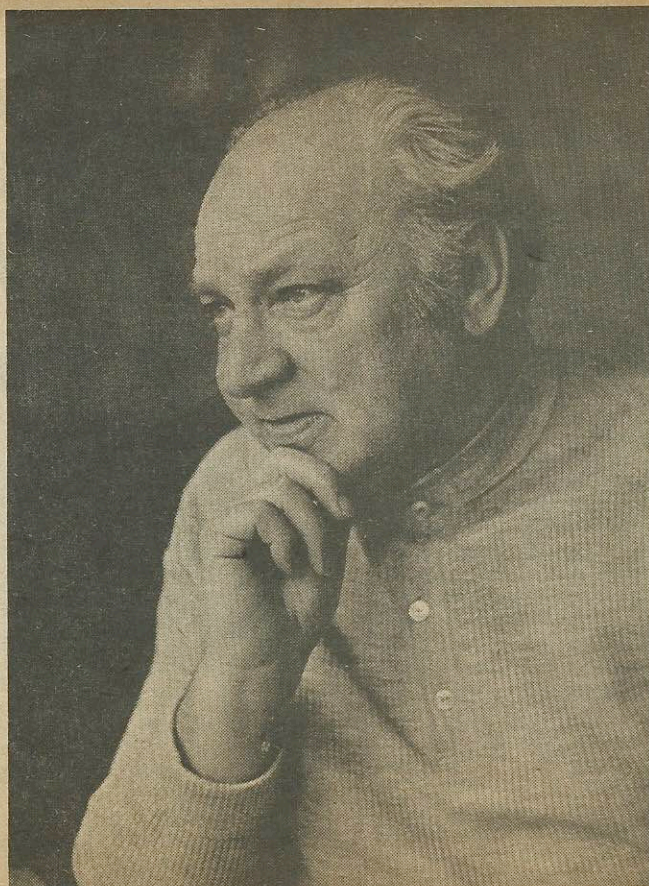
A onď si v nedeľienke čo sa premenila na jednu z naj

Ani sa nenazdáš a unikáš spomedzi veršov. Čierne chrobáčky písmen nezmyseľne tancujú po belobe papiera. Lebo si sa odrazu ocitol na nivách svojho detstva: